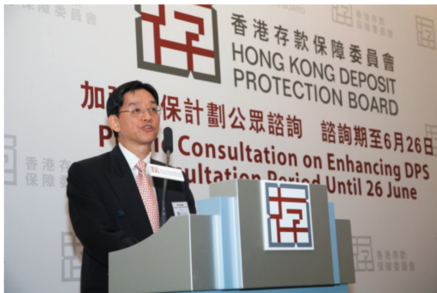
本會主席於加強存款保障計劃公眾諮詢記者會中致辭

首階段的檢討已於2009年初如期完成。雖然檢討結果反映存保計劃的現有設計已大致符合國際最佳慣例，但根據過往運作計劃所得的經驗及新近的國際發展，計劃仍有可改善的地方。例如，我們建議提高保障額及擴大保障範圍至已抵押存款，預期能大幅提升計劃的有效性，以及加強保障範圍的全面性及明確性。同時，本會亦已開始就提升存保計劃的運作效率展開第二階段的檢討。我們相信，就能夠提供清晰及全面的保障，以及具備高效率的發放補償機制這幾方面而言，有關的改善可將香港的存款保障安排置於國際的前列位置。